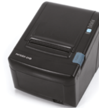
Модель ККТ «Ритейл-01Ф»

Рекомендованная розничная цена (с учетом фискального накопителя)