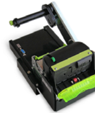
Модель ККТ «ПРИМ 21-ФА»

Рекомендованная розничная цена (с учетом фискального накопителя)