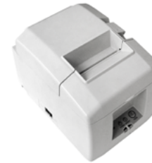
Модель ККТ «ПРИМ 08-Ф»

Рекомендованная розничная цена (с учетом фискального накопителя)