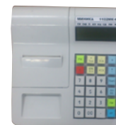
Модель МИНИКА 1102МК-Ф

Рекомендованная розничная цена (с учетом фискального накопителя)