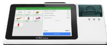
Модель ККТ «Вики мини Ф»

Рекомендованная розничная цена (с учетом фискального накопителя)