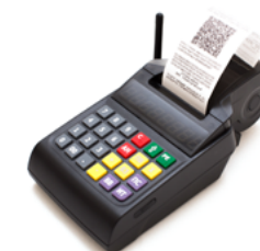
Модель АТОЛ 90Ф

Рекомендованная розничная цена (с учетом фискального накопителя)