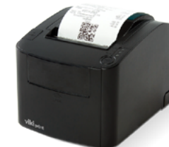
Модель ККТ «Вики Принт 80 плюс Ф»

Рекомендованная розничная цена (с учетом фискального накопителя)