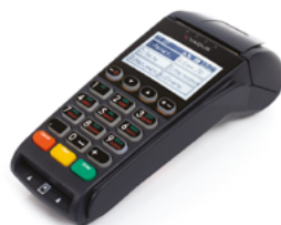
Модель ЯРУС М2100Ф

Рекомендованная розничная цена (с учетом фискального накопителя)