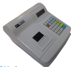
Модель ЭКР 2102К-Ф

Рекомендованная розничная цена (с учетом фискального накопителя)