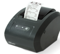
Модель ККТ «Вики Принт 57 плюс Ф»

Рекомендованная розничная цена (с учетом фискального накопителя)