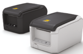
Модель ККТ «PP-01Ф»

Рекомендованная розничная цена (с учетом фискального накопителя)