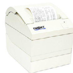
Модель Пирит 1Ф

Пирит 2СФ (с Ethernet кабелем) – 36 000 руб.