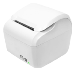
Модель Пирит 2Ф/Пирит 2СФ

Рекомендованная розничная цена (с учетом фискального накопителя)