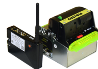
Модель ККТ PAYONLINE-01-ФА

Рекомендованная розничная цена (с учетом фискального накопителя)