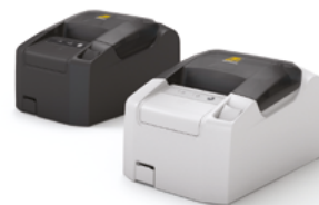
Модель ККТ «PP-02Ф»

Рекомендованная розничная цена (с учетом фискального накопителя)