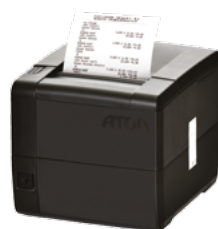
Модель АТОЛ 25Ф

Рекомендованная розничная цена (с учетом фискального накопителя)