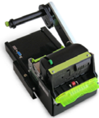
Модель ККТ «ПРИМ 21-ФА»

Рекомендованная розничная цена (с учетом фискального накопителя)