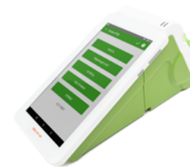
Модель ККТ «Эвотор СТ2Ф»

Рекомендованная розничная цена (с учетом фискального накопителя)