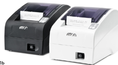
Модель АТОЛ FPrint-22ПТК

Рекомендованная розничная цена (с учетом фискального накопителя)