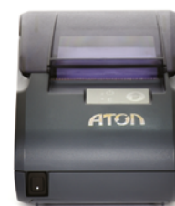
Модель АТОЛ 30 Ф

Рекомендованная розничная цена (с учетом фискального накопителя)