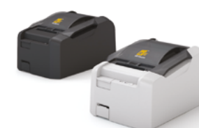
Модель ККТ «PP-03Ф»

Рекомендованная розничная цена (с учетом фискального накопителя)