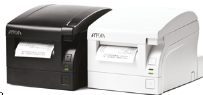
Модель АТОЛ 77Ф

Рекомендованная розничная цена (с учетом фискального накопителя)