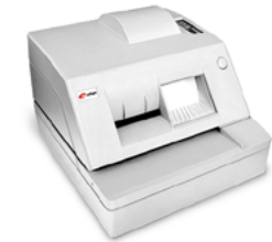
Модель ККТ «ПРИМ 07-Ф»

Рекомендованная розничная цена (с учетом фискального накопителя)