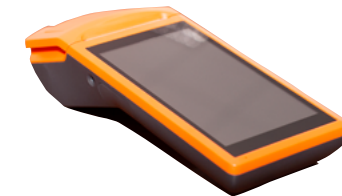
Модель ПТК «MSPOS-K»

Рекомендованная розничная цена (с учетом фискального накопителя)