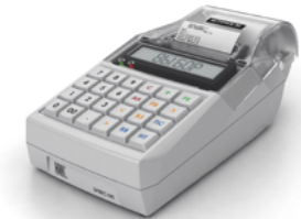
Модель ККТ ЭЛВЕС-МФ

Рекомендованная розничная цена (с учетом фискального накопителя)