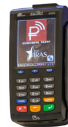
Модель ПТК «IRAS 900 K»

Рекомендованная розничная цена (с учетом фискального накопителя)