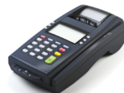
Модель ЯРУС ТФ

Рекомендованная розничная цена (с учетом фискального накопителя)