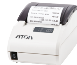
Модель АТОЛ 11Ф

Рекомендованная розничная цена (с учетом фискального накопителя)