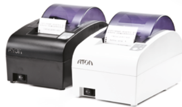
Модель АТОЛ 55Ф

Рекомендованная розничная цена (с учетом фискального накопителя)