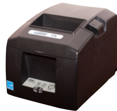
Модель ПТК «MSTAR-TK»

Рекомендованная розничная цена (с учетом фискального накопителя)