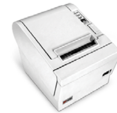
Модель ККТ «ПРИМ 88-Ф»

Рекомендованная розничная цена (с учетом фискального накопителя)