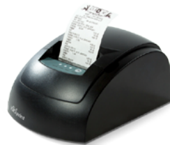
Модель ККТ «Вики Принт 57Ф»

Рекомендованная розничная цена (с учетом фискального накопителя)