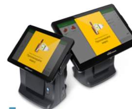
Модель ККТ Viki Tower F

Рекомендованная розничная цена (с учетом фискального накопителя)